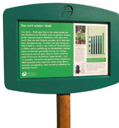
Passend zum Umfeld: Rahmen einer Wald-Informationstafel aus witterungsbeständigem Biokunststoff

Biokunststoffe gibt es schon sehr lange. Die ersten industriell produzierten Kunststoffe basierten auf Cellulose, die zum Beispiel aus Baumwolle gewonnen wird. Im Jahr 1869 produzierten die Brüder Hyatt in den USA mit Celluloid somit bereits Biokunststoff. Auch das einige Jahre später in Massen produzierte Zellglas, besser unter dem Markennamen Cellophan bekannt, entstand auf der Basis von Cellulose. Doch die Entdeckung der Kunststoffherstellung unter Einbezug von Erdöl zu Beginn des 20. Jahrhunderts verdrängte die Biokunststoffe schnell und auf Jahrzehnte, da nun eine deutlich kostengünstigere Produktion von Kunststoff möglich war. Erst in den 1980er Jahren führten vor allem steigende Erdölpreise sowie ein sich allmählich änderndes ökologisches Bewusstsein zu neuen interessanten Entwicklungen auf dem Gebiet der Biokunststoffe.