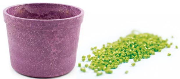
Produktmuster eines Blumentopfes aus Kunststoffen auf Basis nachwachsender Rohstoffe (biobasierte Kunststoffe).

Die Bedeutung von Biokunststoffen wird zukünftig weiter steigen. Gesellschaftliche Trends sowie erwartete Steigerungen der Rohölpreise versprechen ein kräftiges Wachstum in diesem Bereich. Biokunststoffe, und hierbei insbesondere die technischen Biokunststoffe, bilden bereits heute eine nachhaltige ökologische Alternative zu Kunststoffen aus fossilen Rohstoffen. Weitere technische Entwicklungen und eine wachsende Produktion können Biokunststoffe schon in naher Zukunft auch zu einer wirtschaftlichen Alternative machen, ohne dass Kompromisse in der Qualität des Endprodukts hingenommen werden müssen.